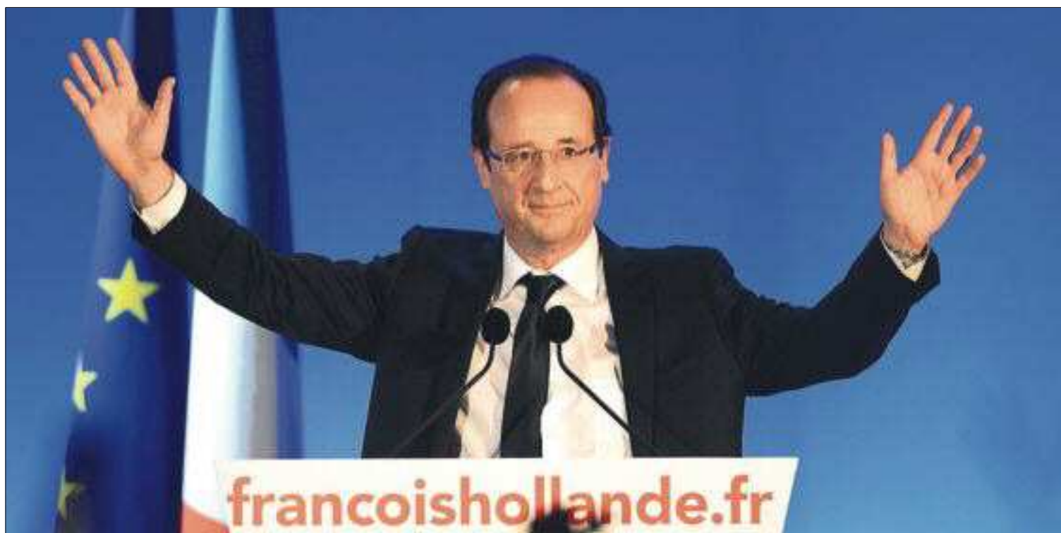
François Hollande saluda a sus simpatizantes en Tulle, ciudad de la que es alcalde, tras conocer su victoria en las presidenciales.